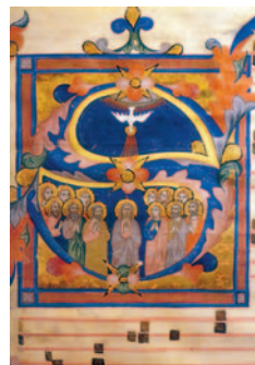
Заглавная буква манускрипта XIV века

С обращением эстонцев в христианство в XIII веке григорианский хорал стал известен также и в Эстонии, и сегодня в местных католических церквях звучат песнопения, которым уже более тысячи лет.