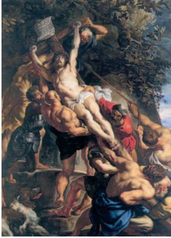
Питер Пауль Рубенс. Снятие с креста, 1610

ную музыку. Церковная музыка представляет собой, прежде всего, принесение хвалы Господу и молитвы, в которых музыка призвана придавать словам большую выразительность.