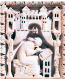
Папа Григорий Великий

В конце VI века Папа Римский Григорий I, прозванный Великим, упорядочил проведение христианских богослужений, а также распределил по датам церковного года используемые в них тексты и песнопения. В честь этого Папы литургические песнопения римской католической церкви получили общее название – григорианский хорал (лат. Gregorius – Григорий).