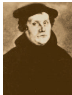
Мартин Лютер (1483-1546)