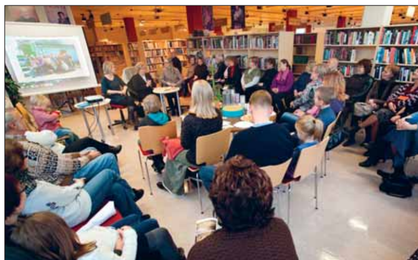
Raamatu esitus 10. detsembril Viljandi Linnaraamatukogus