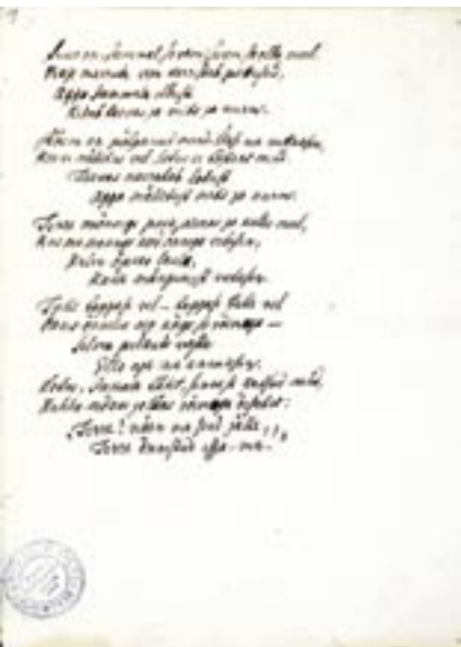
Luuletuse „Suur on, Jumal, su ramm“ autograaf

Pärast Rosenpläneri „Beiträge“ seismajäämist tekkis eesti keele ja rahvaluule uurimises mõneks ajaks otsekui paigalseis. Hiljem hakkas eestihuvilisi haritlasi koondama 1838. aastal Tartu ülikooli juurde asutatud Õpetatud Eesti Selts (ÕES), mille üks asutajaid ja kauaaegne president Faehlmann oli. ÕES oli esimene eesti keele ja rahvaluule ning eestlaste ajaloo uurimiseks asutatud teaduslik ühing.