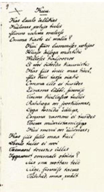
„Kuu” käsikirja esimene lehekülj

Samas on nimetatud luuletused Petersoni muu luulega üs- nagi sarnased. Tema keelendid on veel ühtlustamata ja tundu- vad praegusele lugejale sageli vanamoelised, kuid luuletuste kujundamise joon on sihipärane ja kujundivalik rikas.