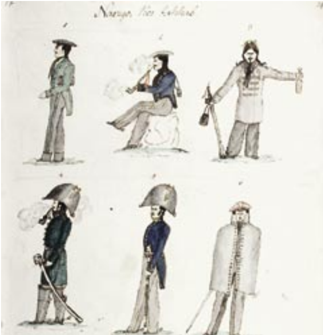
Päevaraamatu joonistuste leht

Mõni usub, et ta üht asja teab, nõnda kui, et inimene peab headust armastama; aga küüsi tema käest: „Mikspärast peab see nõnda ja mitte teistviisi olema?” – siis tema ei tea midagi. See tuleb sellest, et nad ilma juureta puud seavad.