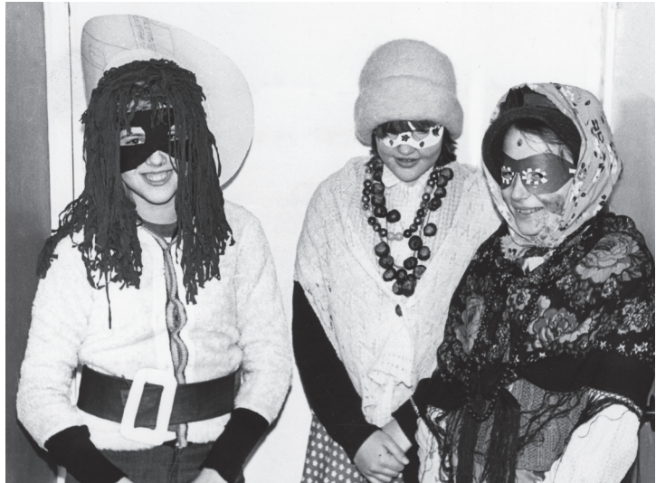
Mardisandid tule- vad tuppa. Tartu.