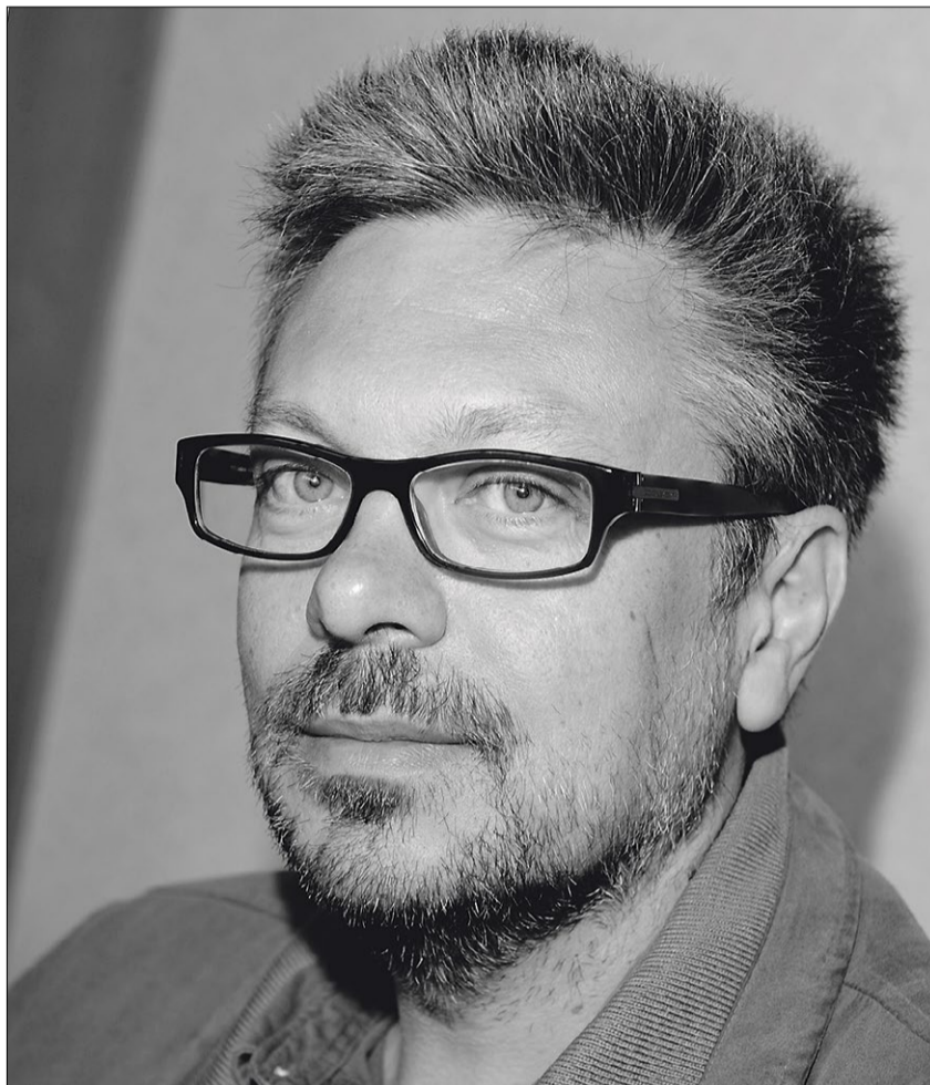
Vene uuema põlve üks tunnustatumaid väärtkirjanikke Mihhail Šiškin.

„Izmaili vallutamise” juurde asudes tuleb kõigepealt märkida, et kaht Šiškini romaani eesti keeles ilmumise järje-