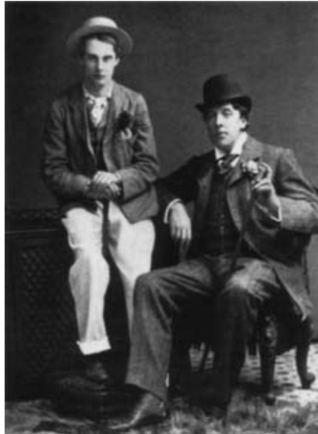
Helmut Berger nimiosalisena „Dorian Gray portree” ekraniseeringus (1970, režissöör Massimo Dallamano)

Praegu on seda raske mõista, kuid esmailmumisel tekitas romaan päris suure skandaali ja oli neidki, kes nägid selles lausa saatana kätetööd. „Dorian Gray portree” populaarsus aga püsib endiselt – sest tegemist on nimelt