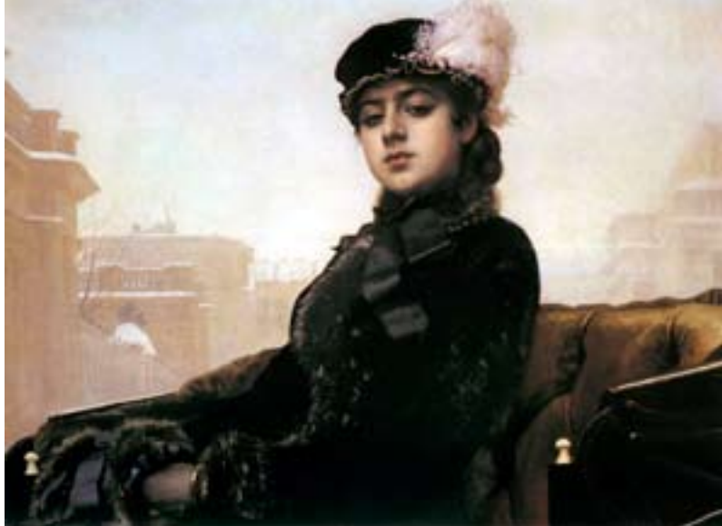
Ivan Kramskoi. TUNDMATU NAINE

ga kokku saada. Sellest sai ta aru, ainult ühte ta ei mõistnud: miks väljendas ema nägu hirmu ja häbi?... Ta pole milleski süüdi, aga kardab isa ja häbeneb midagi. Poisil oli küsimus valmis, mis oleks talle kõik kahtlused selgeks teinud, aga ta ei julgenud küsida: ta nägi, et tema kannatab, ja tal oli temast kahju. Ta surus end vaikides ema ligi ja ütles sosinal: