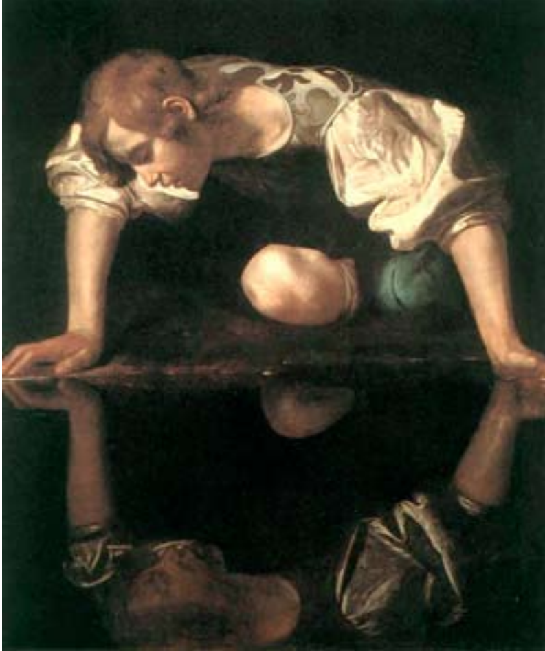
Caravaggio. NARKISSOS ARMUB OMA PEEGELPILTI

Romaan ise, omamoodi mõistujutt kunsti ja tegelikkuse vahekor- rast, kipub eessõna kategoorilisi väiteid pigem kummutama. Tähtsama- teks tegelasteks peale nimikangelase, imekauni noormehe Dorian Gray on kunstnik Basil Hallward, lord Henry Wotton ja näitleja Sibyl Vane. Kunstisse, oma töösse armunud Basil Hallward on läbi kogu elu otsi- nud tõelist ilu, et sealt inspiratsiooni saada ning luua midagi erilist, ja tutvunud Dorian Grayga, leiab noormehes iluideaali. Kunstnik otsustab maalida Dorianist portree. Selle töö juures püüab askeetliku eluviisiga Hallward Dorianile ühtlasi sisendada oma eluväärtusi, nagu kasinus, ausus, headus ja osavõtlikkus, kuid noormeest lummab hoopis elumehe lord Wottoni särav vaimukus. Dorian imetleb lordi kõlblusetut nauti- misfilosoofiat ja püüab teda matkida. Alguse saab ka nende armuafäär – lord Wotton, kelle eesmärgiks on vaid elumõnude otsimine ja kannat- tuste vältimine, suudab Doriani uskuma panna, et ilu õigustab kõike. Vaest maalikunstnikku ei vajata enam. Hallward kingib portree model- lile, aimates, et midagi nii täiuslikku ei maali ta enam kunagi.