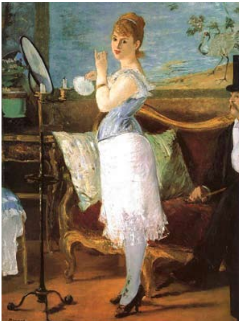
Édouard Manet. NANA (1877)

Zola parimaid romaane on „Žerminaal” (1885, eesti keeles ilmunud ka pealkirjaga „Söekaevurid”). Prantslaste silmis kannab sõna „žerminaal” sümbolset tähendust – see oli Suure Prantsuse revolutsiooni kalendris kevadkuu nimetus. Zola, kuulnud streigist Põhja-Prantsusmaa mäetööstuses, otsustas kaevurite eluga lähemalt tutvuda. Tema ainesesüvenemist tunnistab romaanis esitatud üksikasjalik pilt kaevandustööst, kaevureid vaimselt ja füüsiliselt muserdavatest töötingimustest. Naturalistina annab Zola palju ruumi kirjeldustele, sageli pidurdavad need tegevustki, koormavad süžeearendust. Teiselt poolt aga märkas kirjaniku terane silm nii mõndagi sellist, mis jäi tavalise vaataja eest varjule, ent oli elu tõelise sisu mõistmiseks esmajärgulise tähtsusega.