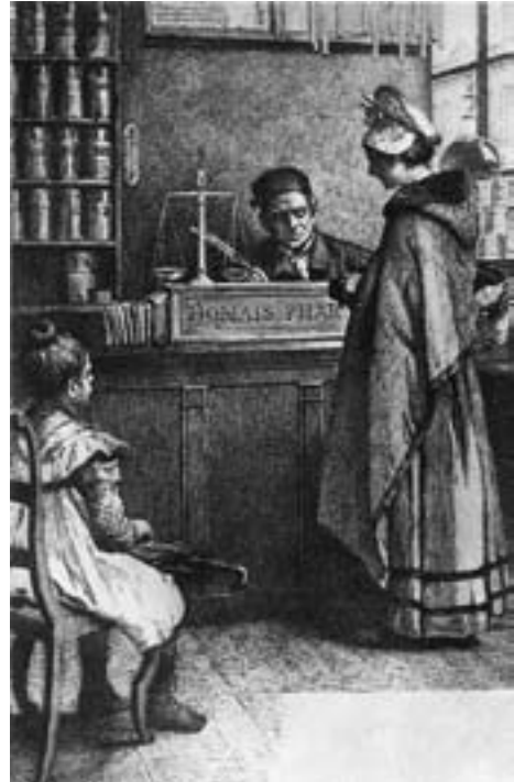
Illustratsioon „Madame Bovary” 1890. aasta väljaandest. Puulõige Alfred Richemont’i joonistuse järgi

Ühel ilusal hommikul oli vikont selle lõpuks kaasa võtnud. Millest küll kõneldi hetkel, kui see asjake ise veel lebas laial kaminasimsil lillevaaside ja pompaduurkellade vahel? Emma on siin, Tostes’is, aga vikont on nüüd juba Pariisis. Pariisis! Milline määratu sõna! Ta kordas seda oma lõbuks mitu korda. See kõlas ta kõrvus nagu katedraali suure kella kumin, see seisis nagu tulikirjas koguni ta pumatipotikese etikettidel.