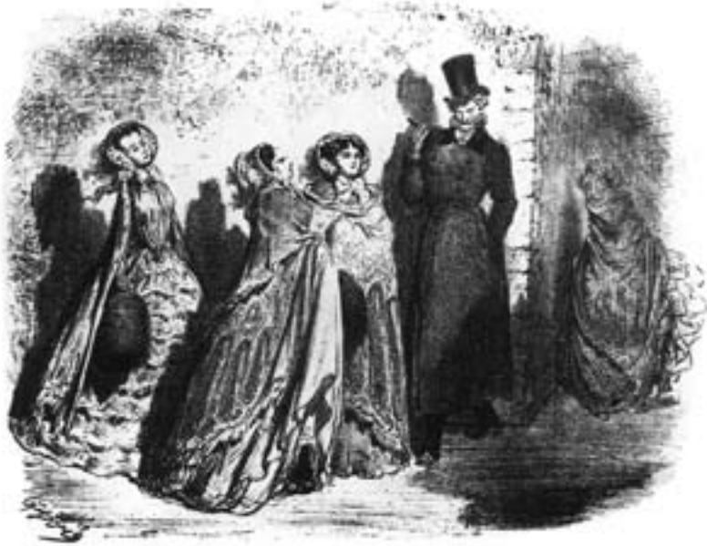
Gustave Doré. ÕÖKULLID. Litograafia

aristokraatliku seltskonnadaami salongi vahel ning näitab, et neis on külalisteks ühed ja samad inimesed. Nana, omamoodi küll hea ja usaldav, soovib jõukat elu ja võimalust oma poeg muretult üles kasvatada ning on valmis selle eesmärgi poole pürgima vahendeid valimata, ent samal ajal ei suuda ta oma kirgi talitseda. Tema tee lõpeb kurvalt, ta sureb rõugetesse.