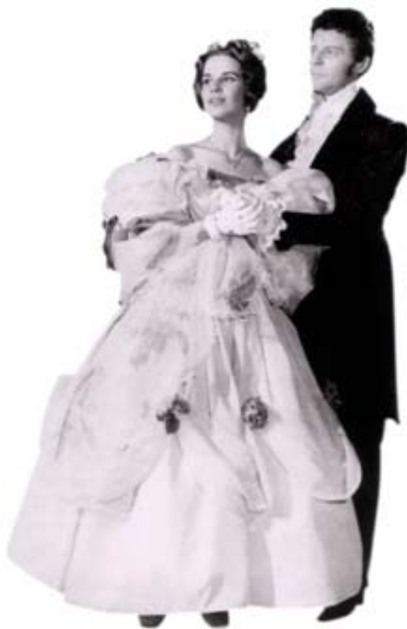
Antonella Lualdi ja Gérard Philipe „Punase ja musta” ekraniseeringus (1954, režissöör Claude Autant-Lara)

Mind sunnib sõna võtma hirm põlguse ees, millest ma arvasin võivat üle olla oma surmasilmapiilgul. Mu härrad, mul ei ole au kuuluda teie klassi, te näete enda ees lihtrahva poega,